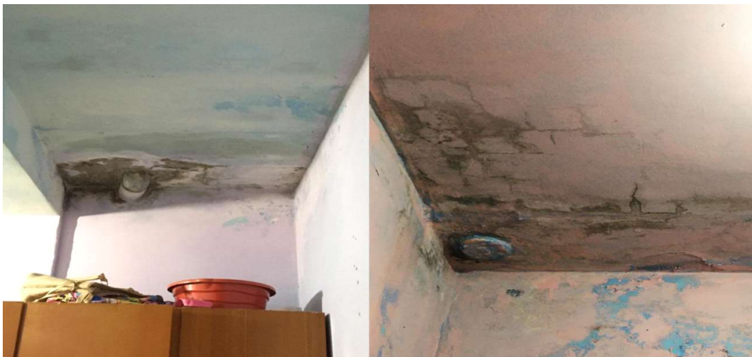
Figura - Infiltrações com risco de desabamento da laje