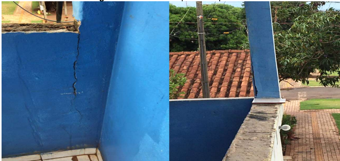
Figura - Problemas nos pilares

Também foram observadas trincas na sacada da fachada e também rachaduras na edificação vizinha. Por conta do período com chuvas, as infiltrações são frequentes criando transtornos aos usuários do imóvel e trazendo um risco maior para o local. A parte de baixo da escada sofre o mesmo problema das vigas e pilares que estão sem o cobrimento necessário do aço e com isso a armadura fica aparente. Um problema relatado no local, aponta que o solo está cedendo em quase todo o terreno, com isso o locatário adiciona concreto toda vez que o solo trabalha, com isso, pode-se identificar movimentação excessiva um grande risco para qualquer estrutura ou obra de engenharia. O preenchimento com concreto, pode até ser uma solução temporária, mas não definitiva e eficaz, pois não está de acordo com normas de engenharia.