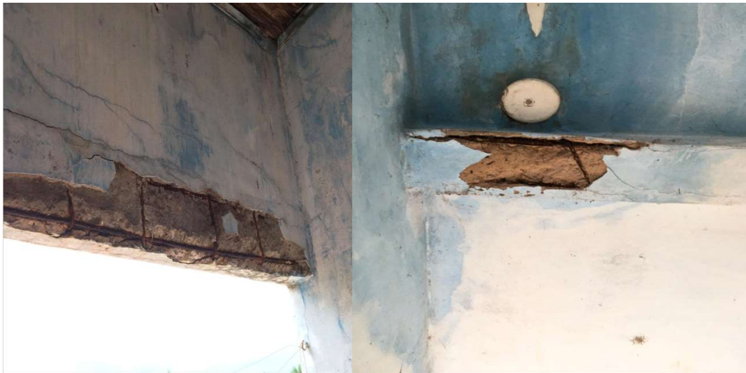
Figura - Vigas com deslocamento de concreto

Quanto a parte estrutural observou-se que o sobrado é o local mais afetado, algumas vigas e pilares encontram-se sem seu cobrimento de concreto necessário deixando assim armadura exposta, fazendo com que a estrutura fique desprotegida trazendo assim riscos para a edificação. Com a falta de concreto naquela região pode-se observar que houve uma perda de desempenho precoce, uma falha construtiva. Com isso o aço começa um processo de perda de resistência e o risco de rompimento se torna eminente. Temos também ocorrência de trincas no sobrado e beiral bastante afetado pela ação do tempo. De acordo com a visita, observa-se outro pilar com problema na parte da fachada do sobrado com uma rachadura bem significativa que pode indicar que o pilar está sofrendo esforços de cargas elevadas e assim sofrendo com flambagem e compressão excessivas.