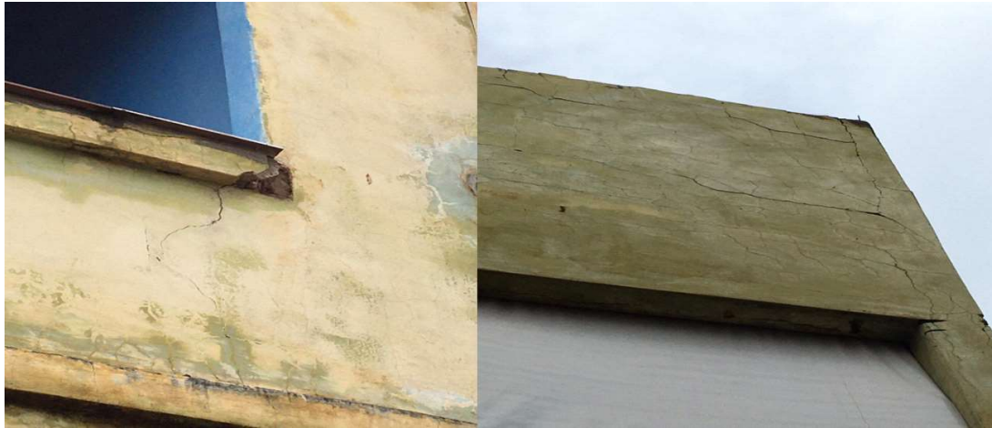
Figura - Trincas e desaprumo da platibanda