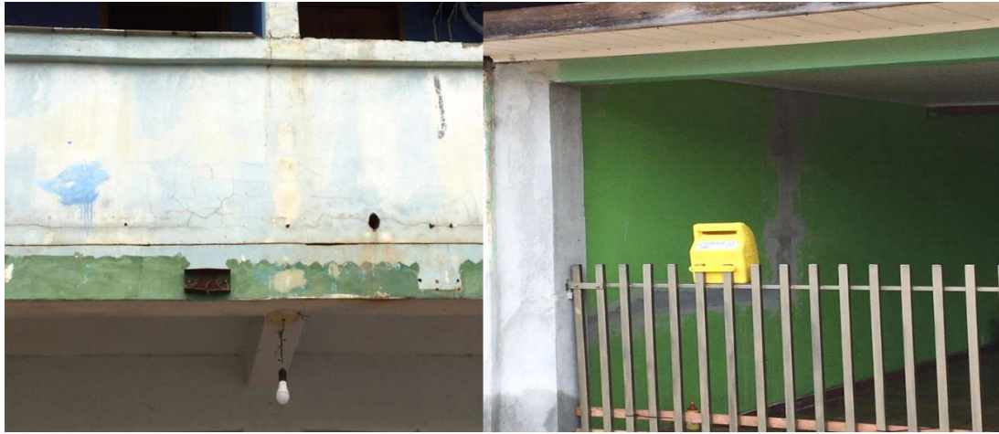
Figura - Fachada com trincas e rachaduras na vizinhança