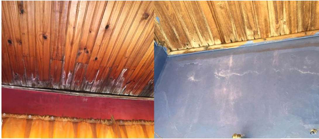
Figura - Apodrecimento de forro devido a infiltração